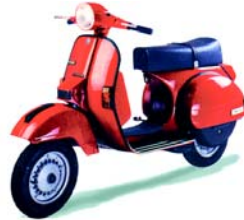
Vespa originale 150

Servicio de mantenimiento con personal y equipos altamente calificados