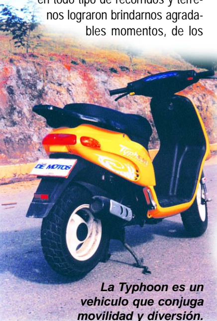
La Typhoon es un vehículo que conjuga movilidad y diversión.

La Typhoon es una moto de reciente aparición que con su aspecto agresivo y sus llantas anchas marcó toda una tendencia dentro de los Scooters, la cual ha sido seguida por los demás fabricantes. Este scooter procede de Italia, desde donde se surte a toda Europa, y donde es un éxito en ventas, solo superado por su hermana la Vespa,