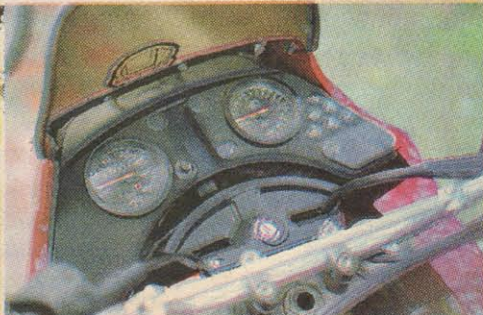
El tablero no es espectacular, pero si muy completo