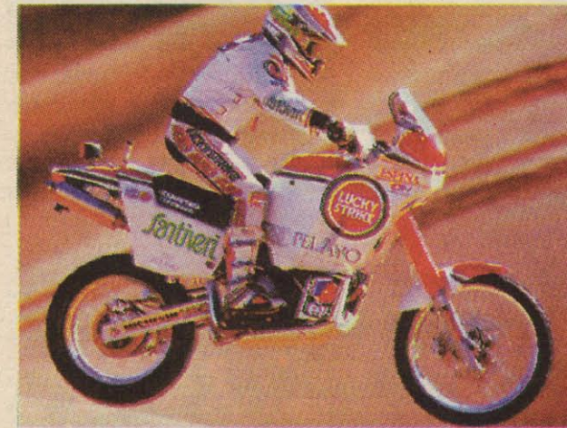
Hermosa Estampa Aquí la vemos volando por el Sahara