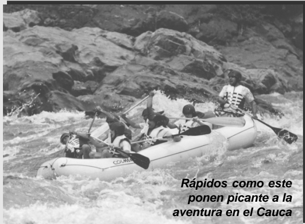
Rápidos como este ponen picante a la aventura en el Cauca

Marranera, el Tamarindo o el Salto del Caballo hacen las delicias de los que se aventuran a navegarlos. A los compañeros que se aventuraron por el río Arma, el gusanito del Rafting parece haberlos picado, pues según ellos su próximo destino será el Cauca, quien esto escribe por aquello de las fotos debió conformarse con mirar desde la orilla, pero seguro que la próxima vez no me lo pierdo. Y ustedes! ¿será que se atreven?