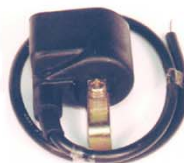
C.D.I. y bobina de alta incorporados