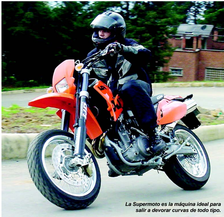
La Supermoto es la máquina ideal para salir a devorar curvas de todo tipo.

Las piezas de la Supermoto también son de primera, suspensiones White Power, frenos Brembo, manubrio Magura, plásticos Acerbis y el mismo nivel de detalles en el acabado de to-