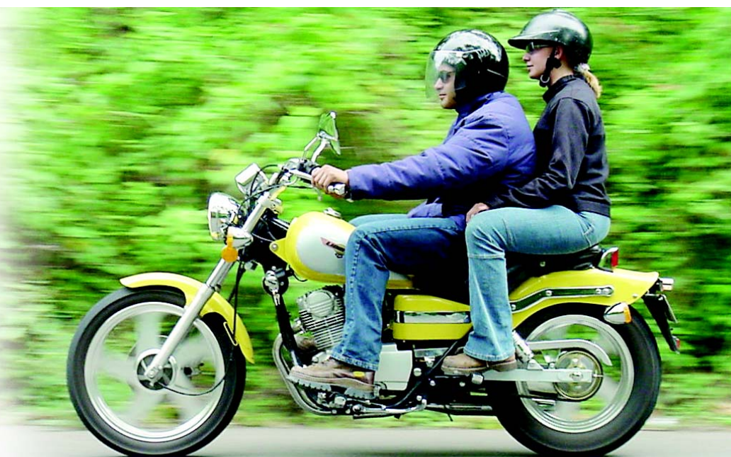
La posición del pasajero es agradable y los pies descansan cómodamente, aunque el asiento se queda corto en sus dimensiones