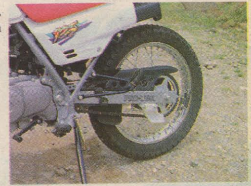
Sistema Pro-Link en el tren trasero. Nadie puede negar que es uno de los principales atractivos de la moto. El amortiguador combina aceite y gas comprimido. Lástima que en esta versión no pueda ser regulado en compresión o rebote, sin embargo la moto se defiende bien.

En Medellín hay un club de XLR llamado "Honda Camel", el cual realiza salidas muy agradables en grupo, además de otras actividades.