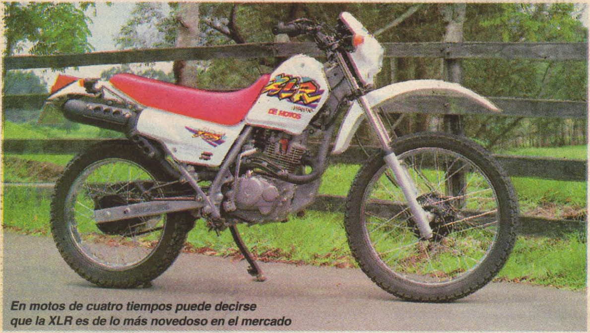
En motos de cuatro tiempos puede decirse que la XLR es de lo más novedoso en el mercado

Tener la posibilidad de probar una moto es siempre algo emocionante, preparar todo el material que se va a necesitar, las cámaras, los formatos para las tomas de datos, documentarse lo suficiente sobre la moto y.... hasta que al fin llega el día señalado y con todo a punto nos dirigimos a recoger nuestra compañera de aventuras. En esta ocasión se trataba de una moto que desde su llegada ha causado un gran impacto, no solo por ser un nuevo modelo (completamente nuevo) sino por ser una