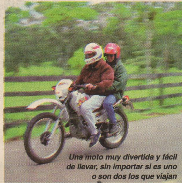
Una moto muy divertida y fácil de llevar, sin importar si es uno o son dos los que viajan

Tener la posibilidad de probar una moto es siempre algo emocionante, preparar todo el material que se va a necesitar, las cámaras, los formatos para las tomas de datos, documentarse lo suficiente sobre la moto y.... hasta que al fin llega el día señalado y con todo a punto nos dirigimos a recoger nuestra compañera de aventuras. En esta ocasión se trataba de una moto que desde su llegada ha causado un gran impacto, no solo por ser un nuevo modelo (completamente nuevo) sino por ser una