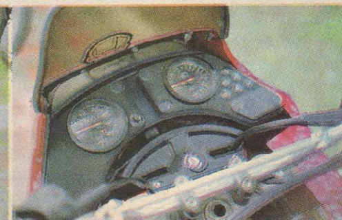
El tablero no es espectacular, pero si muy completo