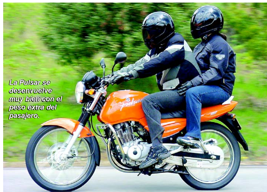
La Pulsar se desenvuelve muy bien con el peso extra del pasajero.

Las suspensiones son confortables y suaves, pero a la vez se muestran muy adecuadas para el carácter deportivo de la moto y es a la hora de exigir las al máximo cuando muestran sus virtudes, incluso con pasajero transmiten total confianza y en ningún momento llegamos a sentir que hicieran tope o movimientos extraños, ni siquiera en las peores curvas donde encontramos el asfalto lleno de rizados. Aquí se debe destacar también el diseño del basculante de la