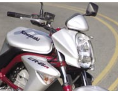
El tablero es de última tendencia, compacto y con la información esencial. De luces está sobrada y el diseño de los plásticos provee protección aerodinámica a alta velocidad.