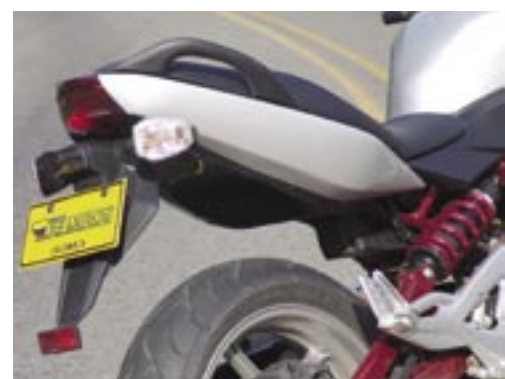
Dos discos tipo flor de 300mm se encargan de parar los 174 kilos que pesa la ER en seco y lo hacen muy bien. La afilada cola cuenta con 2 agarraderas muy útiles para el pasajero