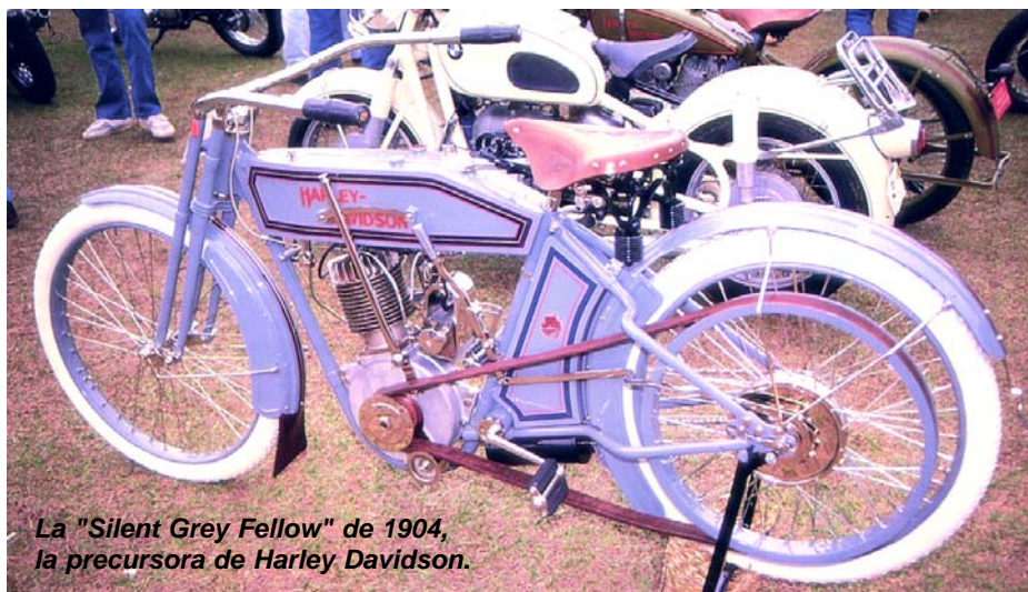
La "Silent Grey Fellow" de 1904, la precursora de Harley Davidson.

Para 1905 el crecimiento fue vertiginoso, 50 unidades salieron a la calle, también la cilindrada subió hasta los 570cc y 4HP, con esto la moto podía superar los 70km/h, se fabricaron 150 en total, de las cuales la primera fue para la policía de Milwaukee, cliente tradicional de la marca en los 96 años de existencia. Otra innovación de la moto fue la suspensión delan-