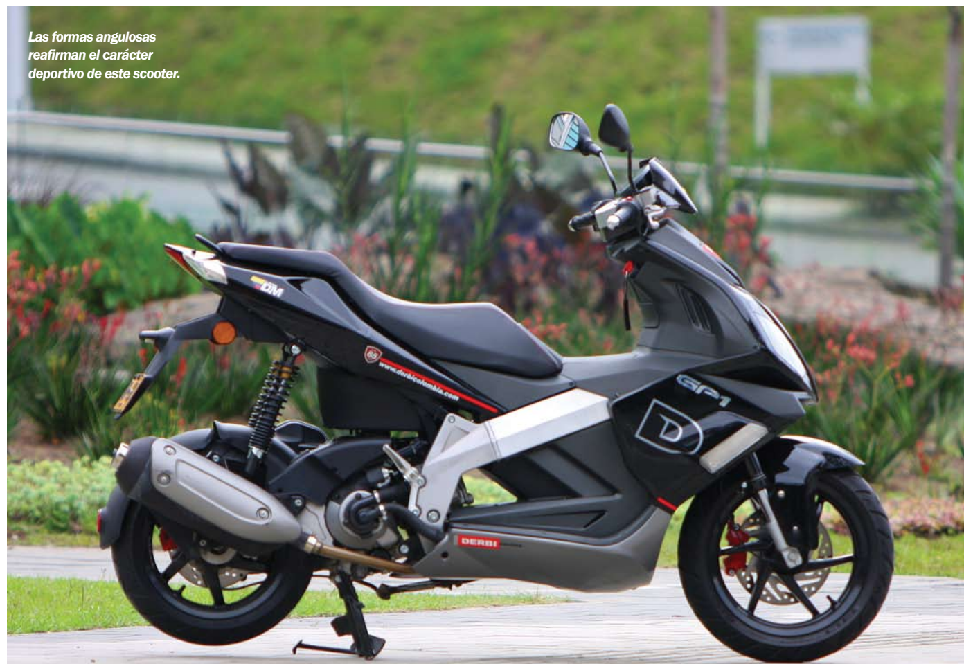
Las formas angulosas reafirman el carácter deportivo de este scooter.

En la redacción las caras de envidia no se