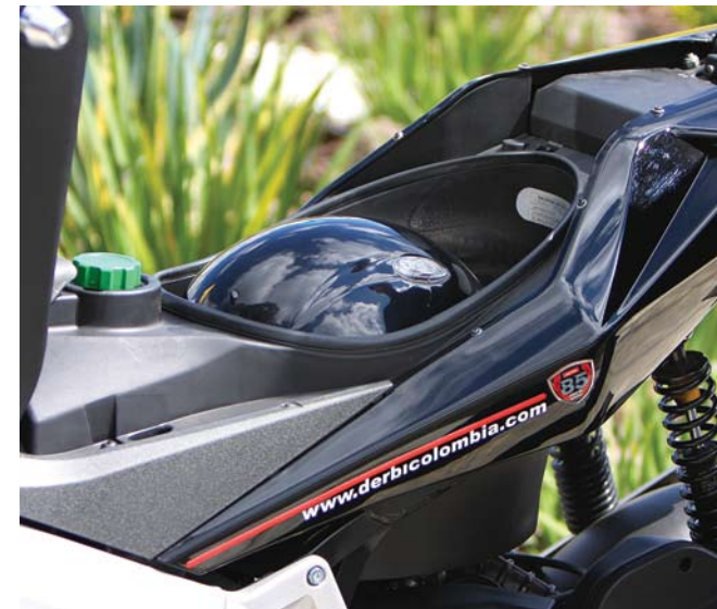
En su baúl bajo la silla cabe perfectamente un casco integral, un detalle que se agradece bastante. Abajo, vemos su gaveta frontal con espacio portamonedas y además una conexión a 12 voltios.

No creo que haya sido la pregunta que se hicieron los españoles al momento de concebir esta moto, pero a pesar de todo se estrujaron tan bien el cerebro que lograron satisfacer las necesidades y gustos de ambos géneros; por ejemplo cuenta con baúl con capacidad para un casco integral, gavetas en los laterales del carenaje para llevar objetos pequeños y para rematar el plus de comodidad, también posee gaveta frontal donde acomodar otros objetos, dotada con un curioso espacio portamonedas, además de una conexión a 12 voltios para recargar el celular o cualquier otro aparato, ¡si las damas quieren más!... la Derbi ostenta unos detalles que vale la pena observar y que la ponen casi al borde de ser una moto deportiva y no un simple scooter, para los hombres el hecho de que no tenga un piso completo (lo que quiere decir que hay que levantar la pierna para subirse), le da un toque muy de "moto"; la suspensión delantera invertida y la posterior de doble amortiguador regulable, su tablero que combina las rpm análogas y los demás datos de forma digital, el gato lateral retráctil automáticamente que aunque es muy racing, cuesta acostumbrarse, hacen del GP1 el scooter más sofisticado y técnicamente avanzado de su categoría en nuestro país, siendo estos detalles los que emocionan de verdad al público masculino que gusta de los buenos juguetes.