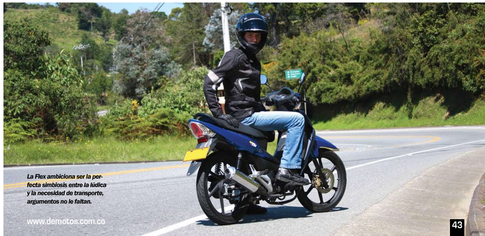
La Flex ambiciona ser la perfecta simbiosis entre la lúdica y la necesidad de transporte, argumentos no le faltan.