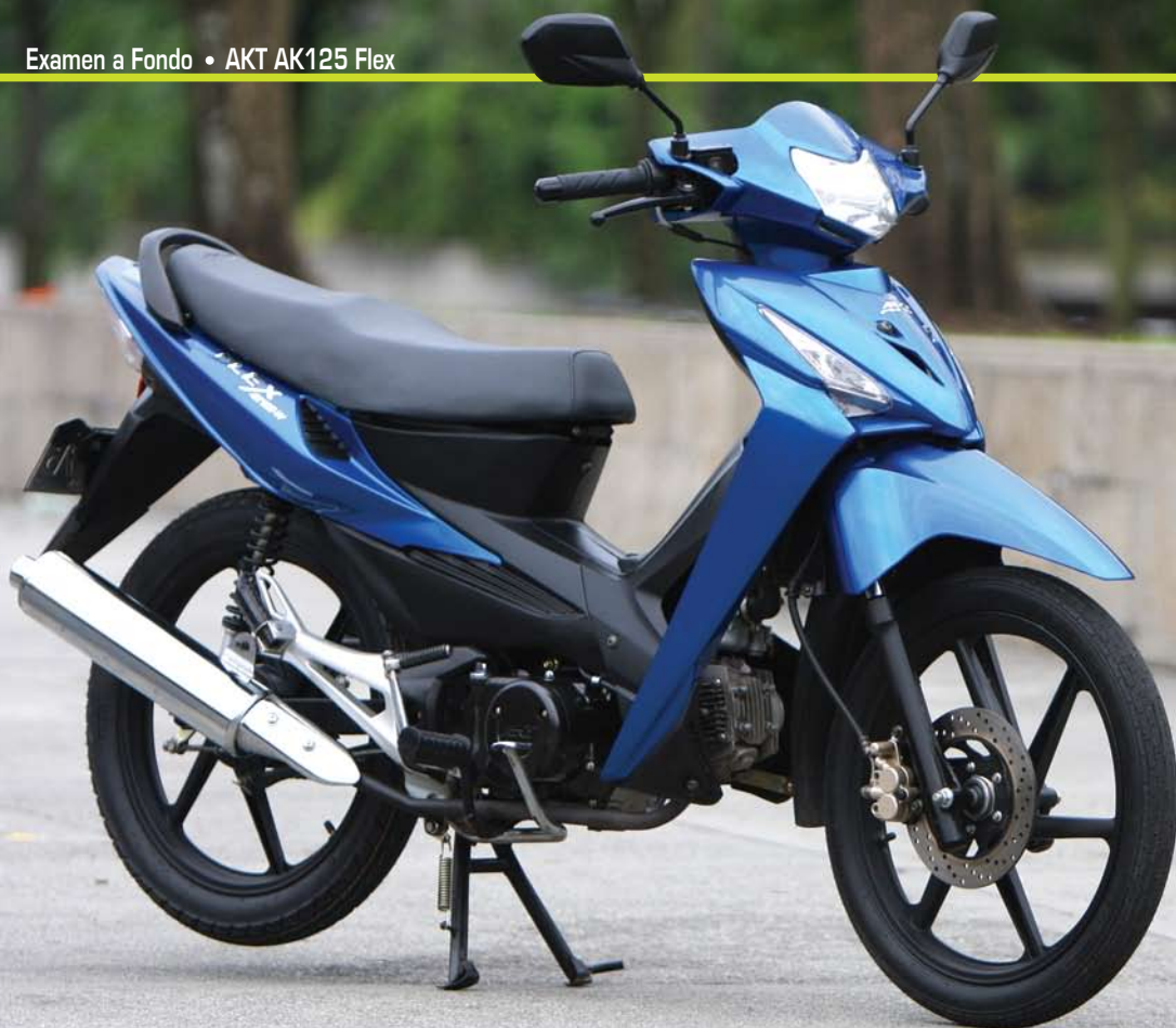
La Flex es una ciudadina 100%. Abajo, detalle del stop y la cola de aerodinámicas formas.

manualmente, pero para desbloquearlo es necesario contar con el cuadrante instalado en la parte inversa de la llave, un sistema bastante funcional y seguro, las luces son por batería y pueden encenderse con solo abrir la llave de contacto siendo suficientes para rodar de noche con tranquilidad. Un detalle que encontramos un poco molesto fue el comando izquierdo que reúne los interruptores de luces altas y bajas, direccionales, pito y shoke todos bastante apiñados siendo difícil encontrar cada uno de los comandos sin mirar, como debe de ser, cada vez que se necesitan.