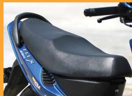
De arriba abajo, el completo tablero con indicador de cambios y los testigos usuales incluido el medidor de gasolina. El freno delantero de una efectividad comprobada. Detalle del "suiche" con su sistema antirrobo. Las novedosas formas de la silla, pensada tanto estética como ergonómicamente.