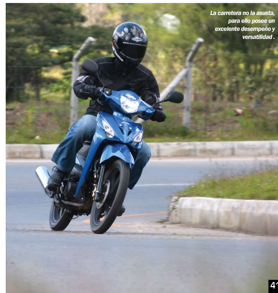
La carretera no la asusta, para ello posee un excelente desempeño y versatilidad.

Grato es que una mopped "normalita" sea capaz de impresionar en aspectos tan específicos como su motor, como es el caso de esta Flex en la que su propulsor entrega 8.6hp a 8000rpm de una manera que confunde, porque su pique, potencia y velocidad final parecen los de un motor con muchos más caballos, ello demuestra lo acertado de su relación tanto de caja como de transmisión secundaria, lo que le permite mantener ritmos alegres en cualquier situación sea de carretera o de ciudad, sin temor a ninguna subida ni a quedar relegado por el tráfico en ningún momento. Es un motor que incita a la diversión para el completo regocijo de propietarios y envidia de observadores. Además, su color negro pavonado inspira confianza con solo mirarlo ¿astucia estética? Probablemente, pero le sienta de maravilla al contrastar muy bien con el resto de la moto. La Flex es una mopped