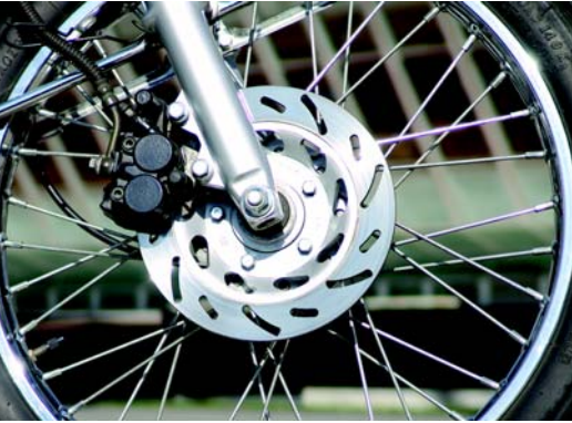
El freno de disco se ha destacado por su buen funcionamiento en cualquier circunstancia.