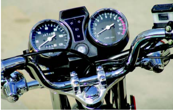
El tablero sobresale por su buen terminado y por brindar bastante información.